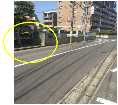
学校の外周で通学路になります