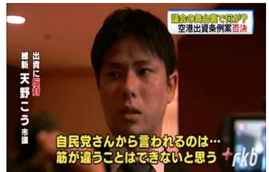
テレビにも取り上げられました

私は出資の必要性はないとして、2月から終始一貫して反対を訴えておりましたが、最後になって所属会派から賛成に強制的に従わせるような拘束をかけられました。会派拘束は重く検討を重ねましたが、これまでの自分の主張と整合性が取れない点や急な拘束に納得がいかず最終的に従わずに反対の一票を貫きました。その結果会派からは除名という処分をされ現在は無所属です。